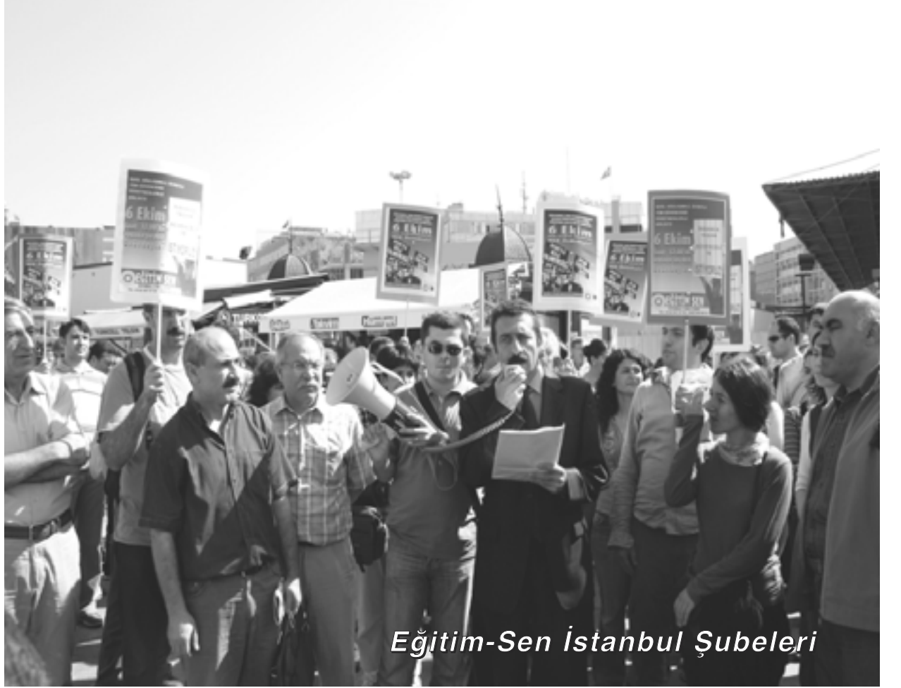
Eğitim-Sen İstanbul Şubeleri

Toplusözleşmeyi masada bitirme isteği taşımalarına rağmen, taleplerini kararlıca savunacaklarını, bu doğrultuda grev tarihini 5 Ekim günü ilan edeceklerini duyuran Akcan, "grev ertelemesi" gibi bir durumla da karşı karşıya kaldıklarında "işe gitmeme" haklarını kullanmaktan çekinmeyeceklerini ifade etti.